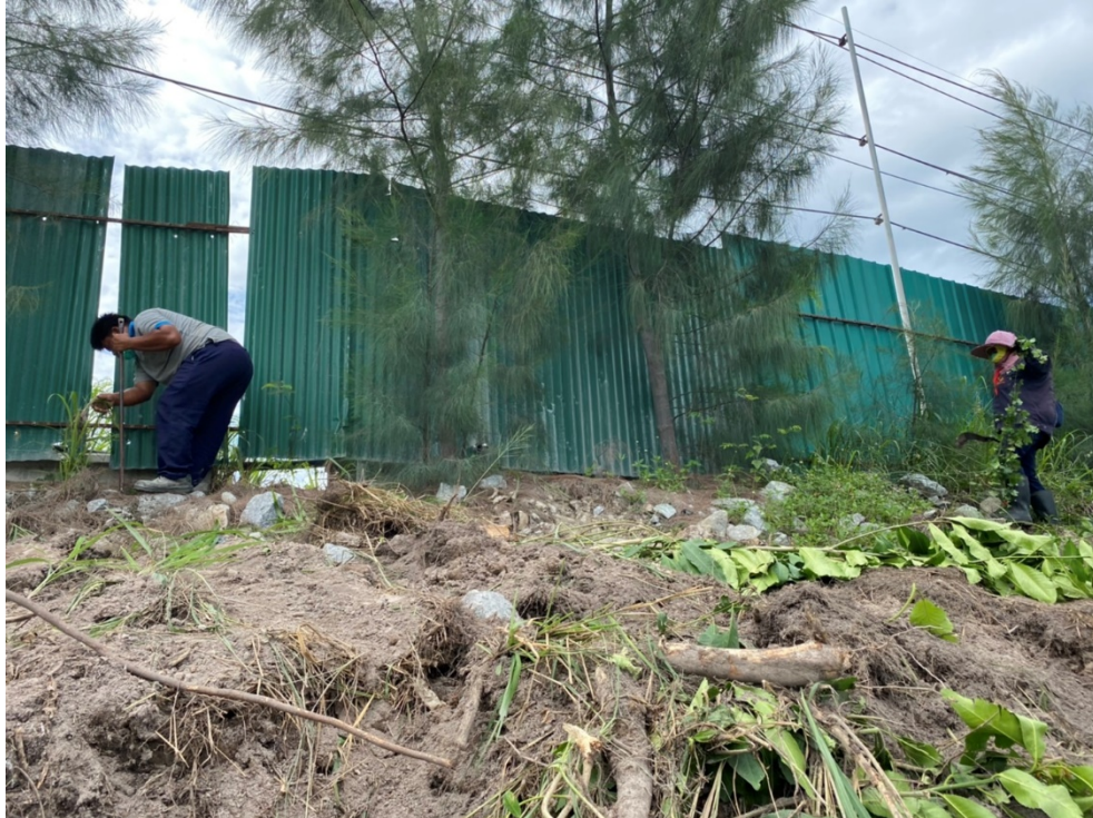
รูปภาพที่ ๕ : ปลูกลงต้นไม้บริเวณโรงโม่หิน