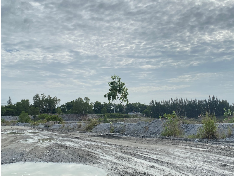
รูปภาพ: การเตรียมพื้นที่ปลูกไม้แนวป้องกันเขตประทานบัตร