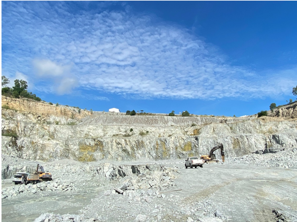
รูปภาพที่ 1 : หน้าเหมืองปัจจุบันของโครงการ