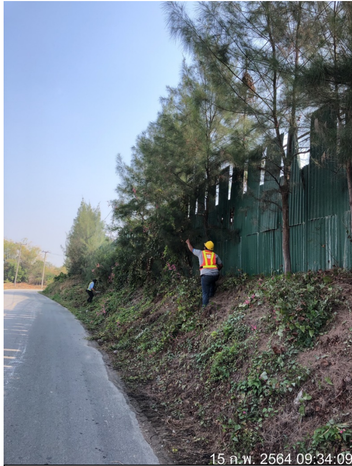
รูปภาพที่ 3 : ปลุกต้นไม้บริเวณบ่อเหมือง พื้นที่ฟันทอง