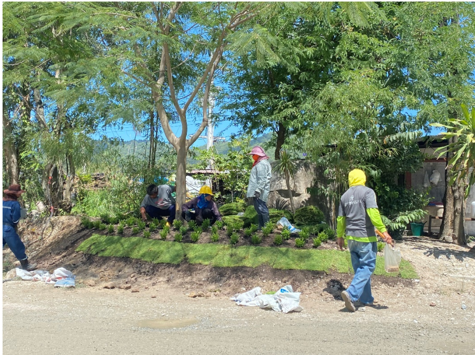
รูปภาพที่ 4 : ปลุกต้นไม้บริเวณหน้าสำนักงานและหน้าบริษัท ฯ