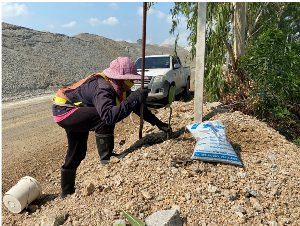
รูปภาพที่ 2 : ปลุกต้นไม้บริเวณขอบบ่อเหมือง