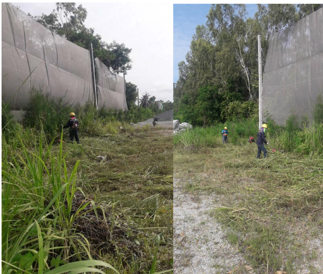
รูปภาพ: ดูแลต้นบำรุงรักษาต้นไม้แนวประทานบัตร