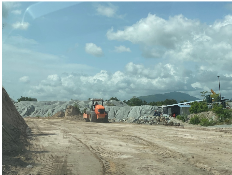
รูปภาพ: การเตรียมพื้นที่ปลูกไม้ท้องถิ่นด้านใต้ของบริษัท