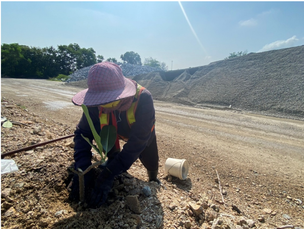
รูปภาพที่ ๖ : ปลูกลงต้นไม้ตามเส้นทางขนส่งหิน